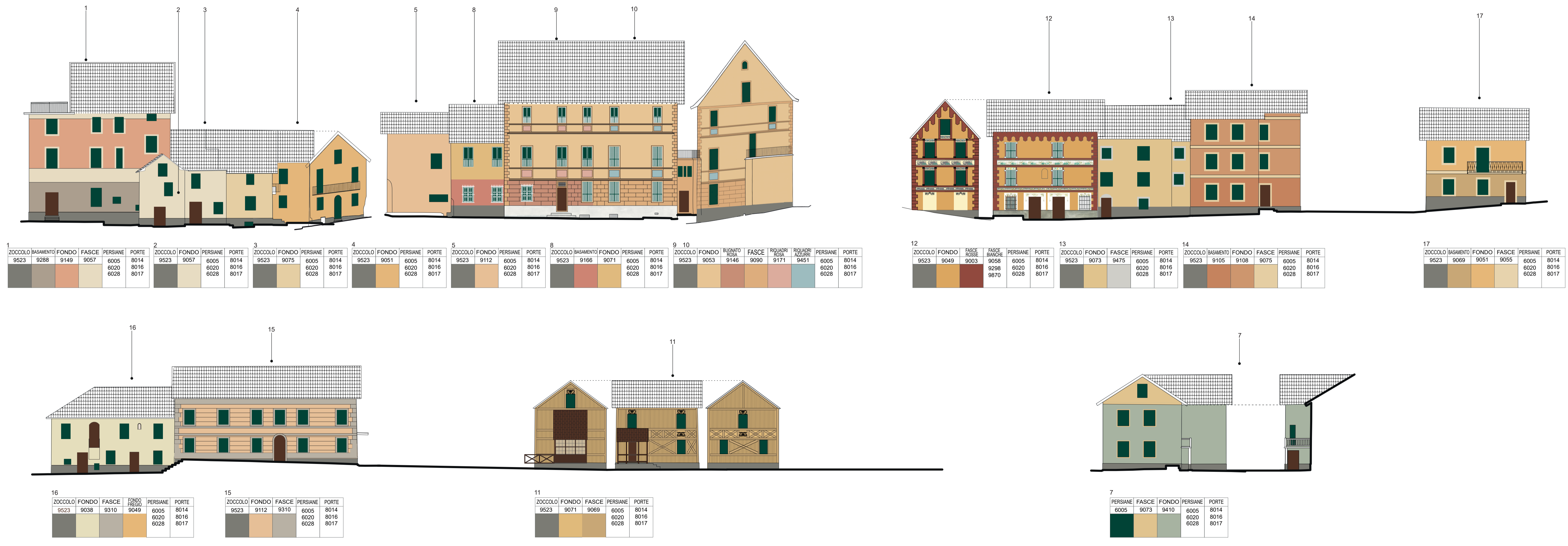
Decorata a finto legno

PIANO DEL COLORE - VERSIONE SEMPLIFICATA